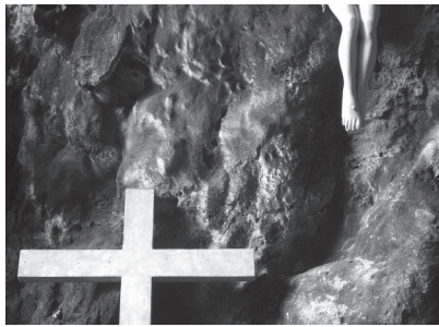
▼ Barlangtemplom, Goa Maria Tritis, Jáva, 2017

tő, a néző kiállítótermi mozgására hat, és azt sugallja, hogy a világ hol megfajtásra váró titok, hol pedig feltárul, megmutatja magát, hogy leleplezze az összefüggéseiben rejlő ismeretlent.” Ez a párosítás legerősebben talán abban a két képben