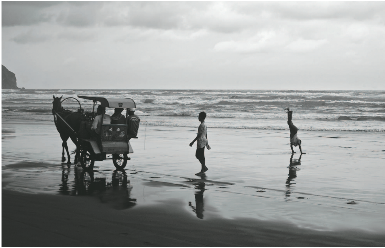
▲ Kézen álló gyermek, Parangtritis, Jáva, 2017

A kiállítás ismertető anyagát érdemes ideidézni a koncepcióval kapcsolatban: „A műveket mint oldalpárokat mutatja be, asszociációra, képi ellentétekre vagy épp hasonlóságokra épít, amiben néhol szerepet kapnak korábbi, Európában készült felvételek is. Az így bemutatott anyag a műtárgy egységét az örökös összehasonlíthatósággal és párosítással elmozdítja abból a pozícióból, ami a fényképet a valóság és az idő kiemelt megörökítésévé tenné. A pillanatok variációkban ismétlődhetnek, egy kompozíció máshol és máskor felidézhető, így a fotográfia is átértelmezhető, képalkotó eljárásá válik. A kicsi és a nagy kép, amely közelről és távolabbról szemlélhe-